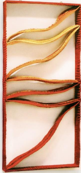
«Puna». Tejido a mano en telar de alto lizo. Montado sobre estructura de acero inoxidable. Materiales: algodón, lana. 70 x 150 x 11 cm. 1991