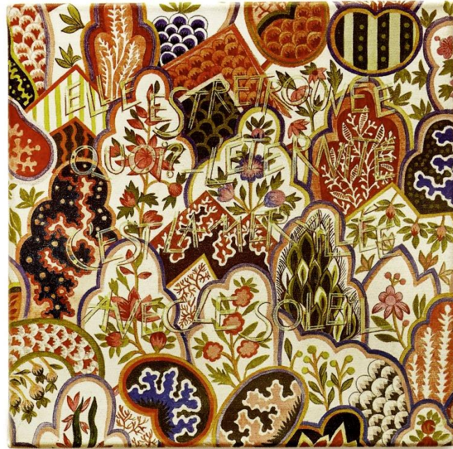
«Jouy-en-Josas esquina Rimbaud». Acrílico sobre tela. 35 x 35 cm. 2014/16.